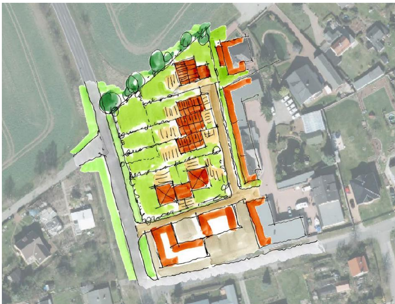
Abb. 3 : Städtebauliche Voruntersuchung ... , Variante 1 (Dipl.-Ing. S. Bolck)

(Kartengrundlage: Quelle BB-Viewer 2018)